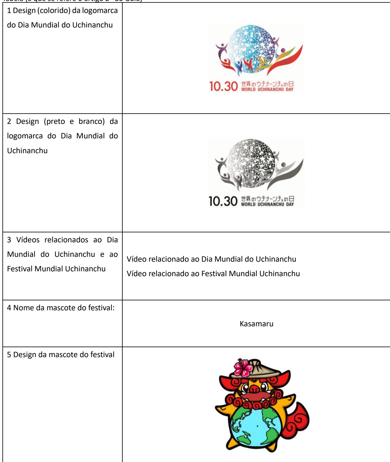
Tabela (a que se refere o artigo 2º do Guia)